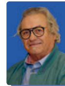
Georges Canal CARCASSONNE (11)