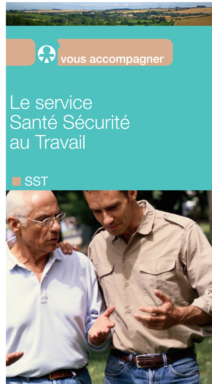
20171023 dépliant prp - Mrt Péquery - SST