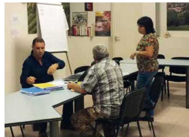
■ L'accueil dédié à la crise, à Arzens en octobre 2014.

La MSA soutient tous ses assurés, exploitants et salariés. Les élus et le personnel de la MSA sont mobilisés au quotidien pour vous accompagner.