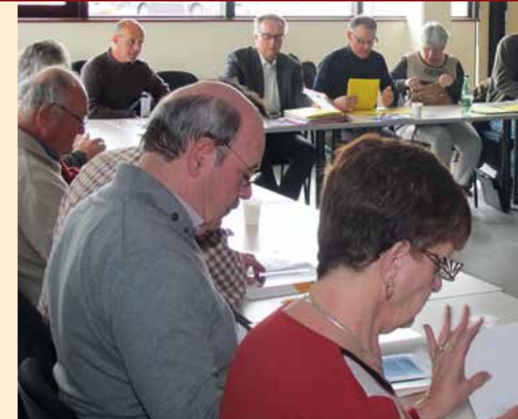
■ Réunion de travail des élus au siège de Narbonne.

La MSA a développé des services sur internet. Sur www.msagrandsud.fr , vous trouvez rapidement de l'information, vous consultez votre dossier personnel de manière sécurisée, vous effectuez des déclarations, vous vous procurez des attestations, etc. (Une cinquantaine de télé-services sont accessibles sur identification). Une application, pour l'instant destinée aux particuliers, complète l'offre en permettant la consultation des paiements et une simulation de droit à une couverture santé complémentaire (CMU-C ou ACS).