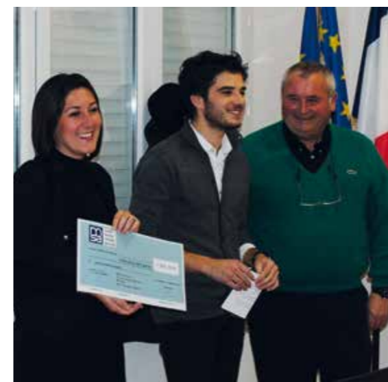
■ Les gagnants de l'Appel à Projet Jeunes à Ponteilla en 2012

✓ Appel à Projet Jeunes : la MSA propose des bourses pour vos projets. L'APJ concerne les jeunes de 13 à 22 ans voulant dynamiser leur vie en milieu rural.