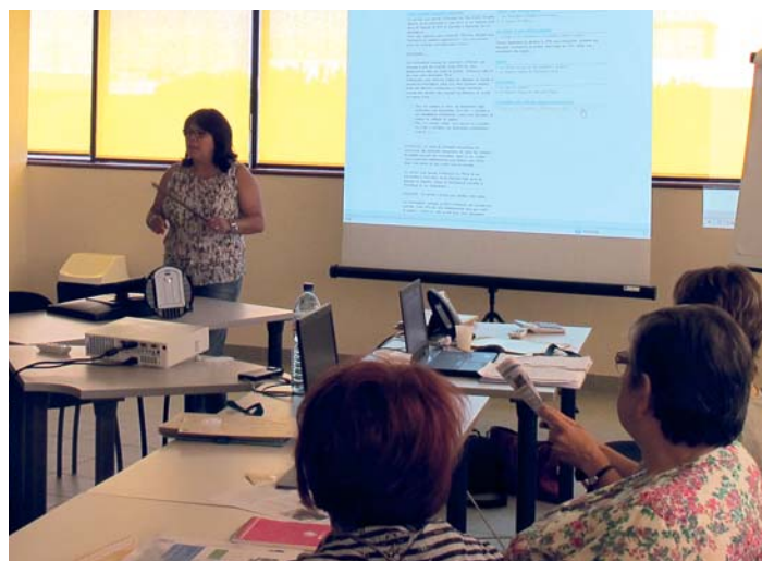
Narbonne, 31 juillet, la conseillère MSA accompagne les employeurs pour se familiariser avec les déclarations sur internet

Environ 250 agriculteurs ont appris progressivement à accomplir leurs formalités via le web. Certains participants étaient déjà inscrits sur l'espace privé internet, mais tous, inscrits ou non, éprouvaient le besoin d'être accompagnés dans leur pratique du web. Satisfaits de la formation, ils utilisent dorénavant les téléservices, dont l'utilisation a effectivement augmenté de 63% sur une année !